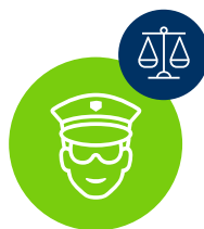
Vrijheid & veiligheid