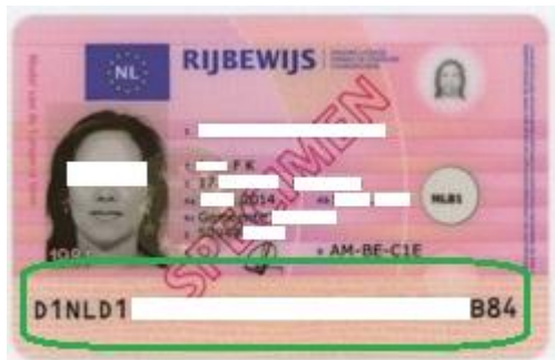
Figuur 1: De MRZ is de groen gemarkeerde regel onderaan (doorgehaald door het CBP).

Met de ID scanner kunnen diverse (buitenlandse) identiteitsdocumenten uitgelezen worden. Voorbeelden zijn identiteitskaarten, verblijfsvergunningen en paspoorten. Het uitlezen ervan kan op twee verschillende technische wijzen: (1) uitlezen van de Machine Readable Zone (MRZ), en (2) uitlezen met behulp van Radio Frequency Identification (RFID) techniek. De MRZ is een strook op het identiteitsdocument met lettertekens die geautomatiseerd kan worden uitgelezen. 58 Niet alle identiteitsdocumenten hebben een MRZ. 59