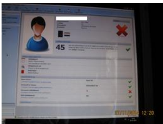
Figuur 3a: het rode kruis geeft aan dat aan de betrokkene een CHO is opgelegd (doorgehaald door het CBP).

De cafés hebben verklaard en het CBP heeft vastgesteld dat de cafés Collectieve horecaontzegging (CHO) en strafbaar feit (bij CHO) verzamelen en vastleggen van bezoekers van de horecagelegenheden. Van betrokkenen die een horecaontzegging hebben opgelegd gekregen verwerken de cafés naast bovengenoemde persoonsgegevens ook de reden van de ontzegging, bijvoorbeeld: "vechtpartij" 70 of "bedreiging personeel" 71 , en de einddatum van de ontzegging ("geblokkeerd tot") 72 . Deze gegevens worden bewaard gedurende de termijn waarvoor de horecaontzegging van kracht is.